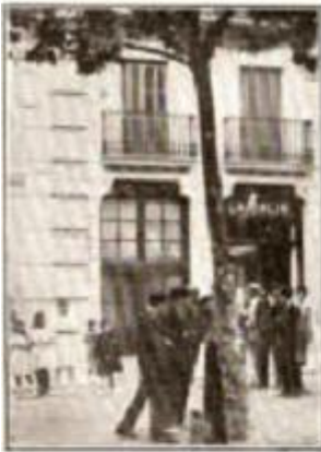
En esta foto se ve a Bravo Portillo en el momento de salir de la casa de la calle de Toledo, y en la que había estado poco tiempo antes de ser asesinado.