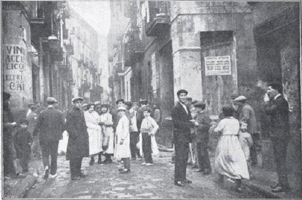
La calle del Mediodía, de Barcelona, y sitio conocido por las Cuatro Esquinas, donde se desarrollaron los lamentables sucesos que ocasionaron la muerte de seis personas y graves heridas a otras varias.

Carrer del Migdia de Barcelona, donde se inició el tiroteo que el 24 de diciembre de 1920 ocasionó la muerte de un cenetista, un pistolero de los Sindicatos Libres, una niña y tres policías