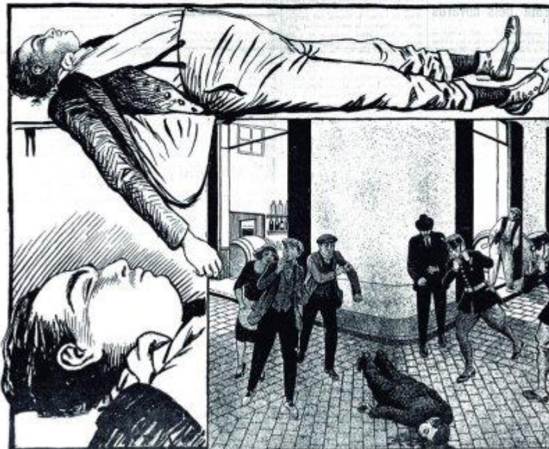
El cadàver del malhaurat "Noi del Sucre" a l'Hospital Clinic