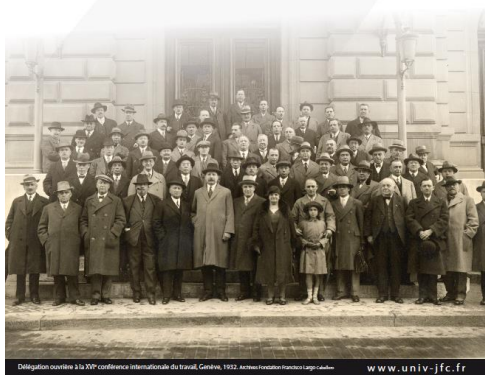
Delegation ouvrière à la 3 ème conférence internationale du travail, Genève, 1922.

Centre Universitaire Jean-François Champollion - Albi Auditorium 2