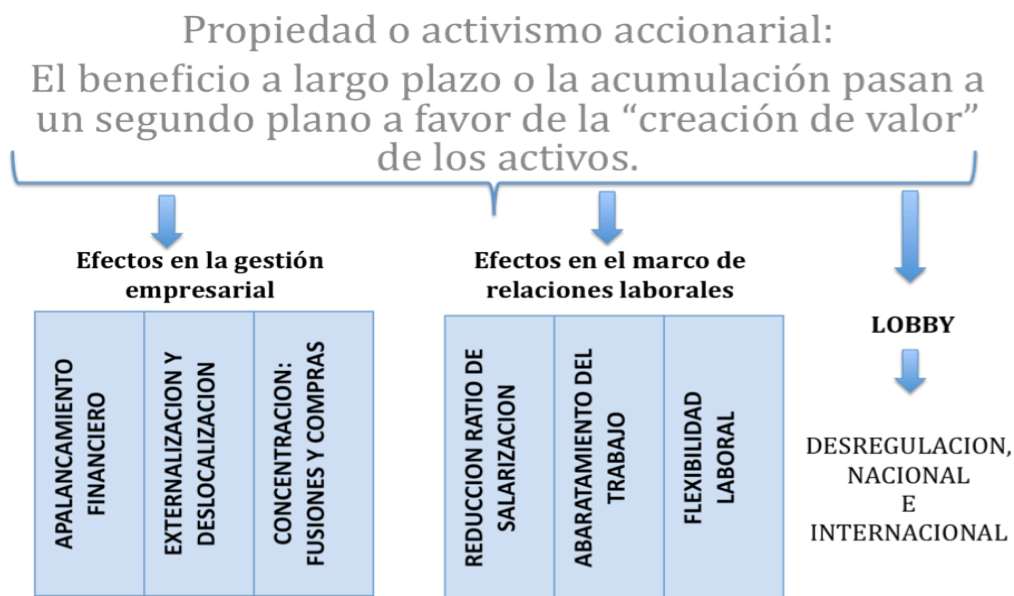
Figura 4. Financiarización: efectos microeconómicos (sobre la gestión empresarial)

se embarca en todo tipo de políticas que erosionan la cantidad de trabajo contratada, ya sea por la vía de fusiones y adquisiciones que hacen redundante un parte del factor trabajo; por la externalización hacia empresas de menor tamaño y con menores salarios de partes no centrales de la actividad de la empresa; mediante deslocalizaciones productivas con los mismos objetivos; por la vía de la concentración en los segmentos y partes de cadena productiva con más beneficios en el mercado y la venta de partes colaterales a empresas de menor tamaño; por la vía directa de los despidos que ajusten en el corto plazo el tamaño óptimo de la plantilla; y por el abandono de estrategias de diversificación productiva, que solapan la actividad de la empresa con la diversificación propia ya existente del capital financiero. Todas estas medidas tienen un fin cortoplacista de revalorización en bolsa del capital a beneficio de los inversores y de los gestores con remuneraciones ligadas a la cotización. Pero que, en no pocas ocasiones, estas estrategias son contradictorias con la supervivencia a largo plazo de la empresa y con los niveles de empleo y producción en el corto plazo.