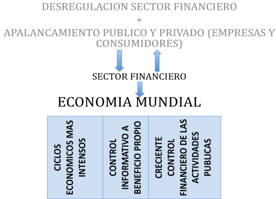
Figura 1. Financiarización: definición y proceso