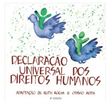
Declaração Universal dos Direitos Humanos