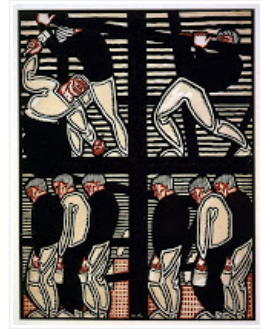
Steel Workers By Weinold Reiss