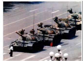
Foto Antológica Tanque China